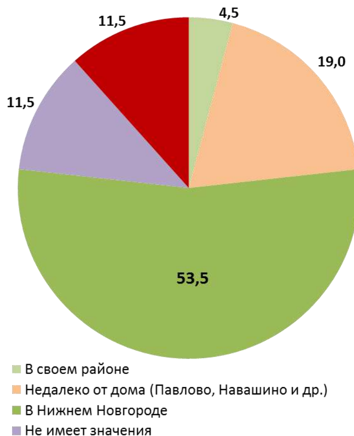
Рис. 4. Географические предпочтения места обучения (учащиеся), в %

Учащиеся 9-го класса значительно чаще выказывали свое намерение продолжить получение образования именно в областном центре – 60,6 % против 49,0 % среди учащихся 8-х классов. Также выше доля намеренных остаться для продолжения образования в ближайших районах среди учащихся сельских школ – 23,1 % против 13,3 % обучающихся в районном центре. Ученики сельских школ несколько чаще выбирали такие варианты ответа, как «не имеет значения» и «затрудняюсь ответить». В совокупности все это свидетельствует о большем уровне неуверенности в собственных возможностях, способностях и материальных возможностях продолжить образование там, где им бы хотелось, и необходимости довольствоваться наиболее доступными вариантами.