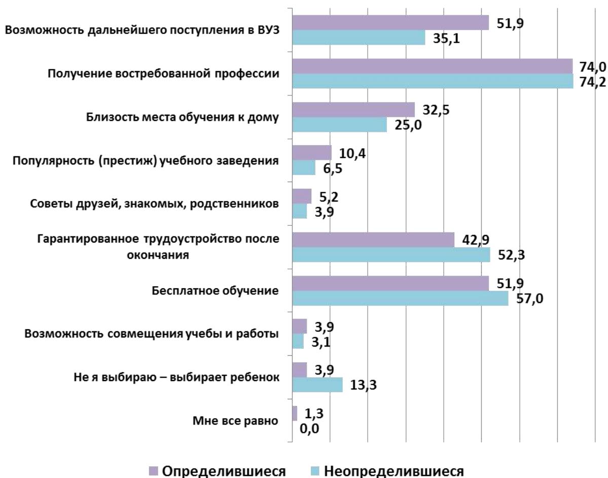
Рис. 6. Факторы, определяющие выбор места обучения (родители), в %

Существуют определенные различия между родителями, чьи дети определились в своем выборе, и теми, чьи ещё размышляют. Для первой группы родителей большее значение имеет возможность дальнейшего поступления в вуз (на 15 % важнее) и близость места обучения к дому (на 7,5 % важнее). Родители неопределившихся детей почти в 4 раза чаще готовы предоставить право выбора своему ребенку (13,3 % против 3,9 %) (см. рис. 6). Кроме того, они акцентировали внимание на бесплатном характере будущего обучения и гарантиях трудоустройства по окончании учебы.