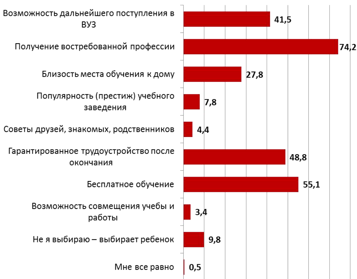
Рис. 5. Факторы, определяющие выбор места обучения (родители), в %

В группе факторов, определяющих позицию родителей по отношению к месту и форме дальнейшего обучения детей, легко выделяются две группы. В основную группу входят факторы, являющиеся значимыми не менее чем для 40 % родителей. Это получение востребованной профессии (74,2 %), бесплатный характер обучения (55,1 %), гарантированное трудоустройство (48,8 %), возможность дальнейшего поступления в вуз (41,5 %) (см. рис. 5). Фактически два из четырех факторов по-разному указывают на одно и то же – качество образования и востребованность специальности на рынке труда, что, в свою очередь, объединяет их с бесплатным характером образования.