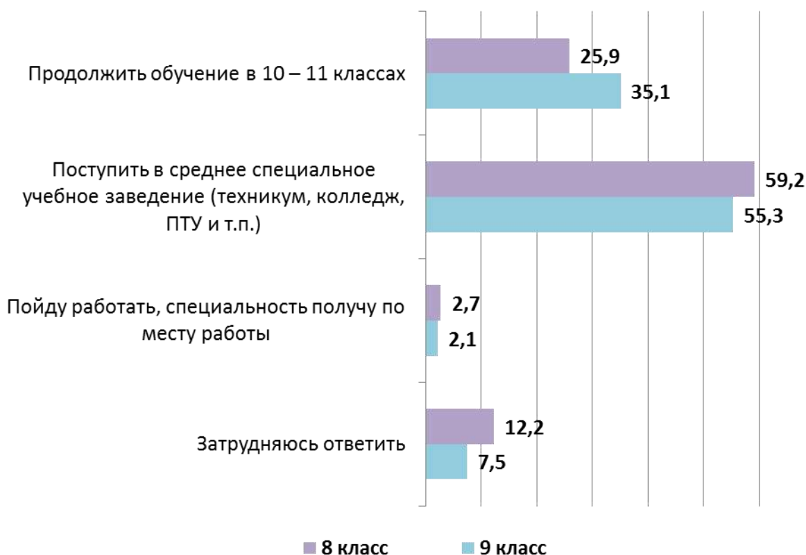
Рис. 2. Планы на будущее после окончания 9-го класса общеобразовательной школы (учащиеся), в %

Планы учащихся на продолжение образования существенно изменяются в зависимости от класса обучения. Так, если в 8-м классе продолжить получение образования в 10–11 классах намерены лишь 25,9 % опрошенных, то в 9-м классе их количество возрастает до 35,1 % (см. рис. 2)