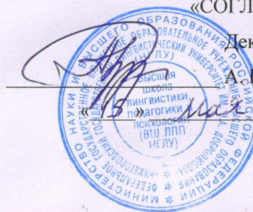
ГРАФИК ЛИКВИДАЦИИ АКАДЕМИЧЕСКОЙ ЗАДОЛЖЕННОСТИ по итогам ЛЭС 2025-2026 учебного года

(прохождение второй повторной промежуточной аттестации)