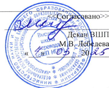
ГРАФИК ЛИКВИДАЦИИ АКАДЕМИЧЕСКИХ ЗАДОЛЖЕННОСТЕЙ ПО ИТОГАМ ЗИМНЕЙ ЗАЧЕТНО-ЭКЗАМЕНАЦИОННОЙ СЕССИИ 2024 – 2025 (прохождение второй повторной промежуточной аттестации) для студентов Высшей школы перевода 11.03. – 15.03.2025