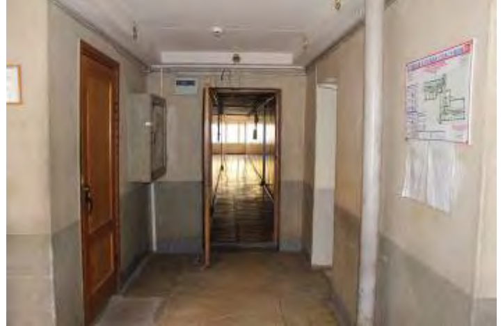
6. Коридор 1 этажа