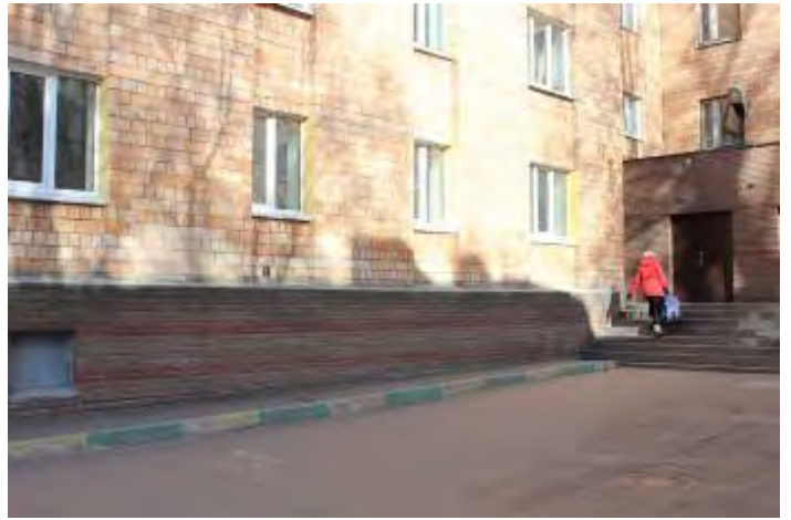
2. Входная группа