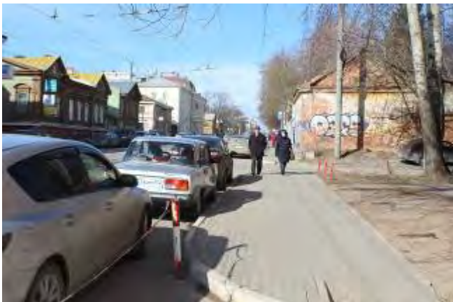
7. Прилегающая территория