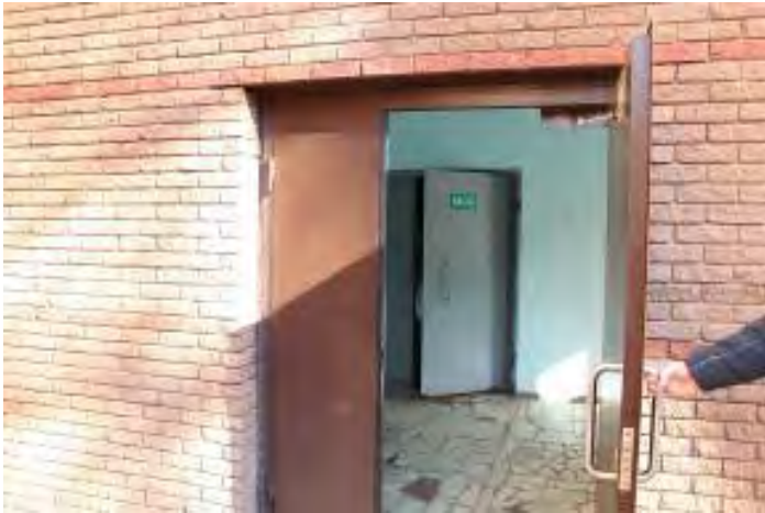
3. Вход в общежитие (тамбур)