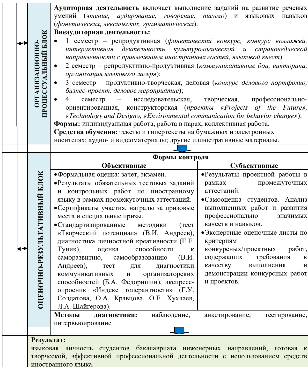
Рисунок 1. Модель рефлексивного обучения иностранному языку, направленная на формирование языковой личности студентов бакалавриата технического университета

Целью рефлексивного обучения иностранному языку в техническом университете является формирование языковой личности студентов бакалавриата инженерных направлений, готовой к эффективной профессиональной деятельности с использованием средств иностранного языка, в тесной связи с развитием рефлексивного мышления и надпредметных когнитивных умений.