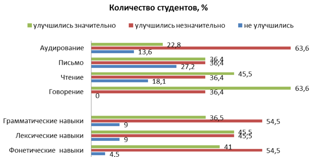
Рисунок 2. Результаты самооценки динамики языковых навыков и речевых умений, выполненной участниками конкурса «Проекты будущего»