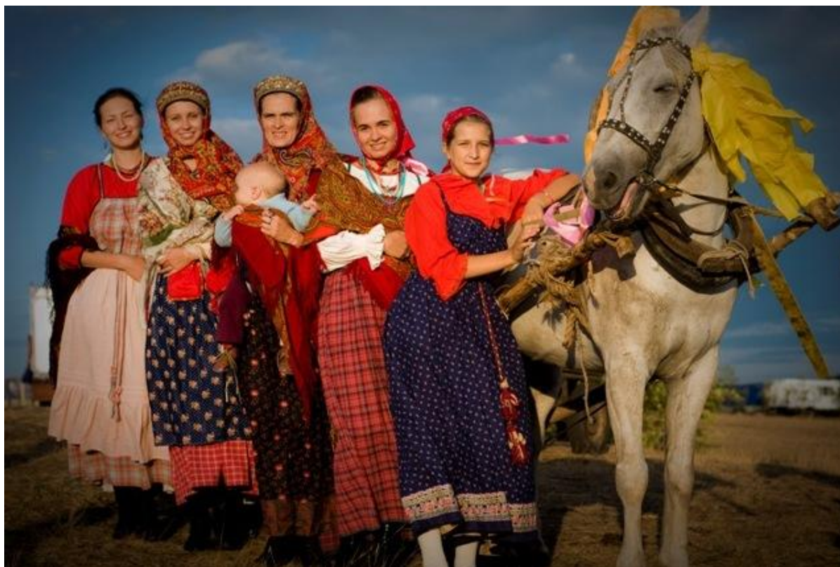
Ансамбль «Синий лен»