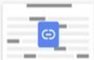
Вставьте пропущенные слова ...