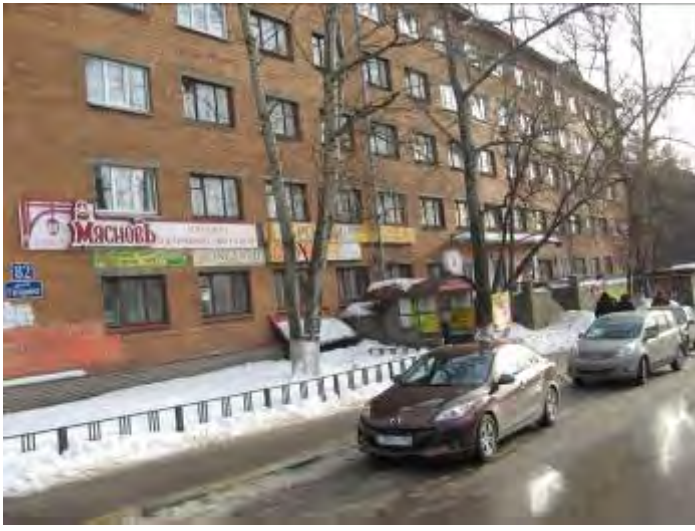
1. Прилегающая территория