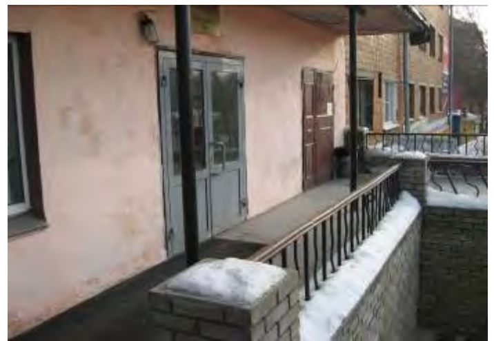
2. Входная группа