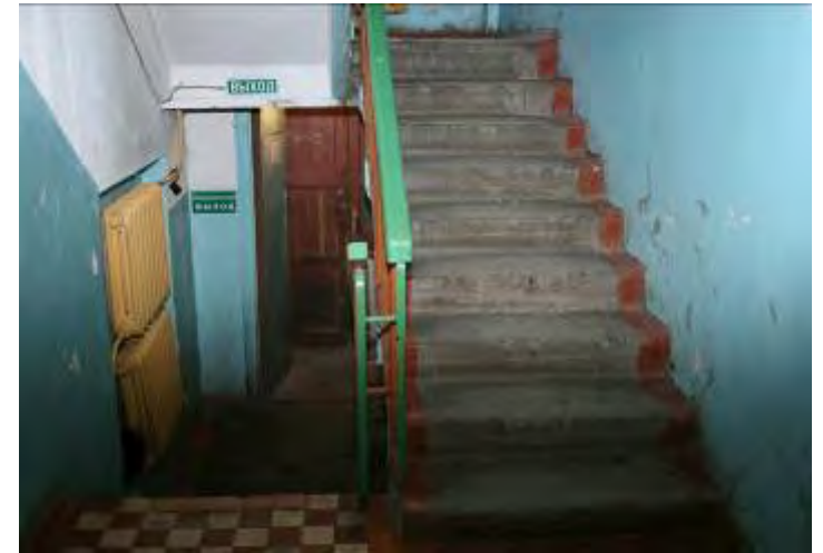
4. Лестничная марш