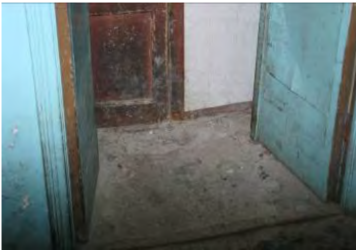
3. Эвакуационный выход