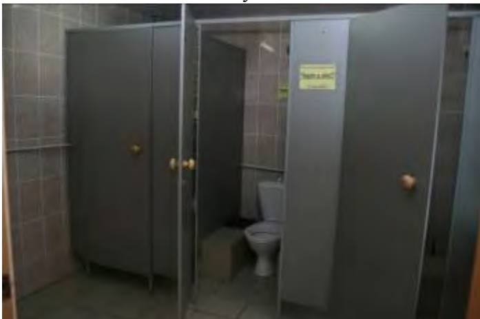
9. Сан. узел