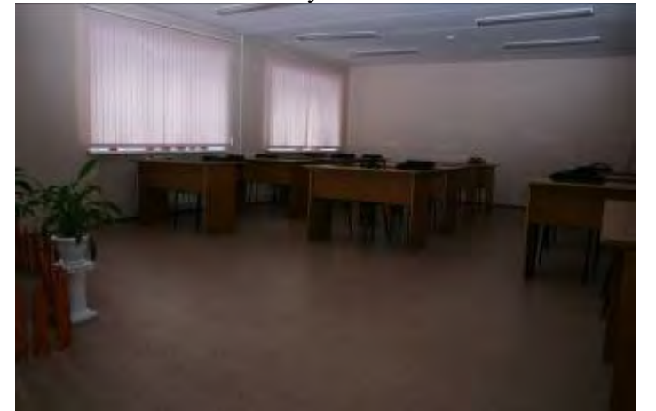
10. Комната для занятий