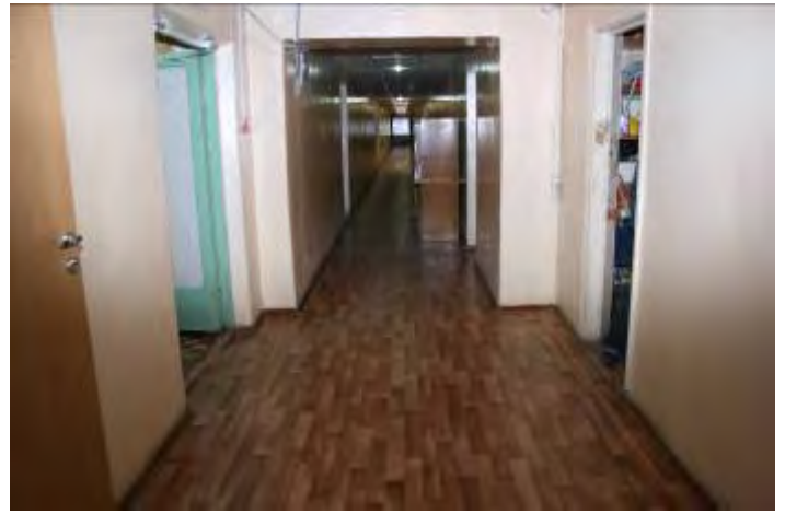
6. Коридор 1 этажа