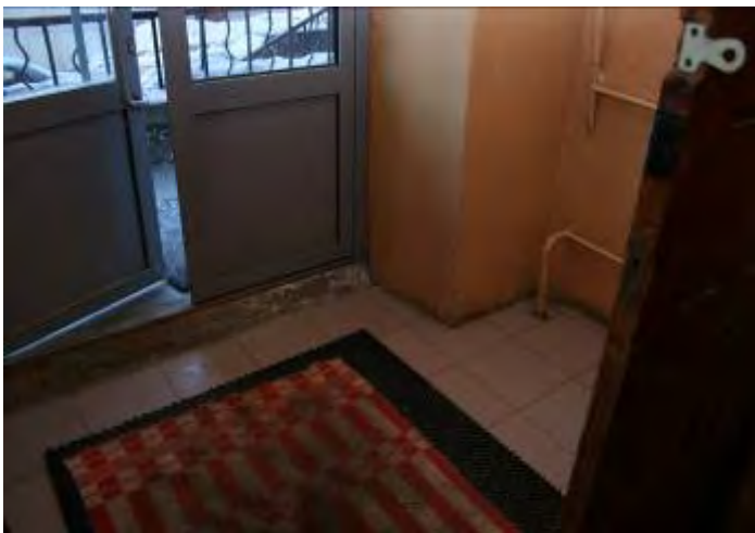
3. Вход в общежитие (тамбур)