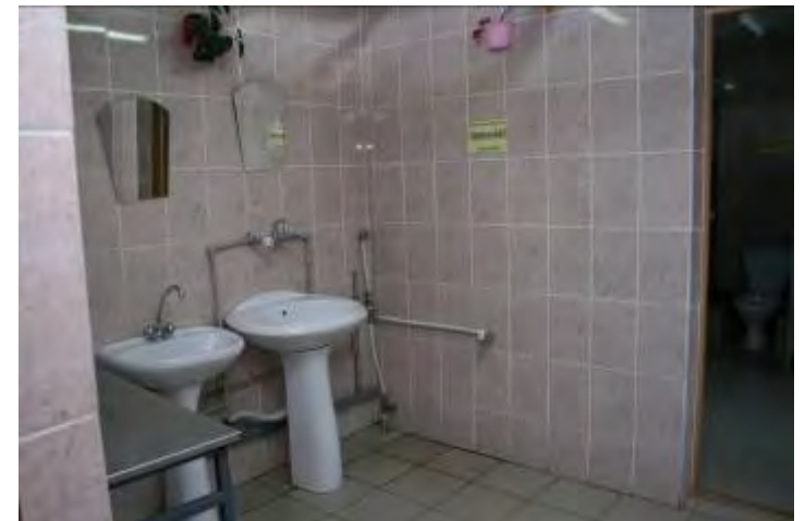
8. Сан. узел