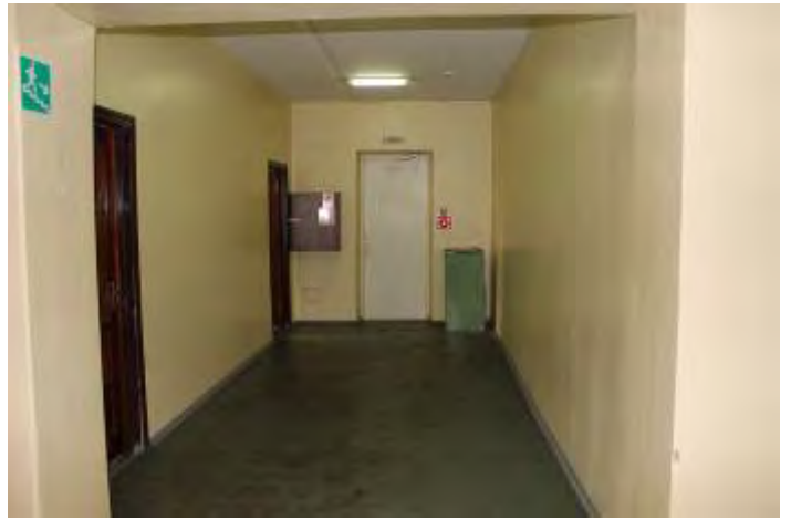
10. Коридор 1 этажа