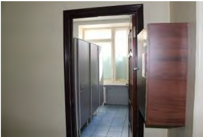
11. Сан. узел