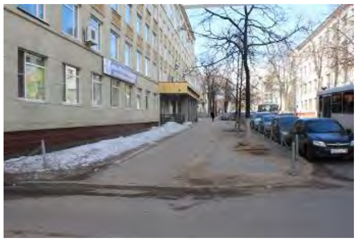
2. Прилегающая территория