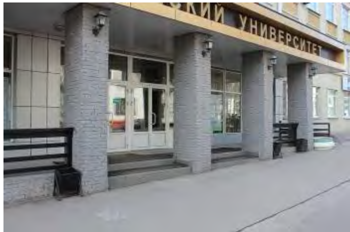
4. Входная группа