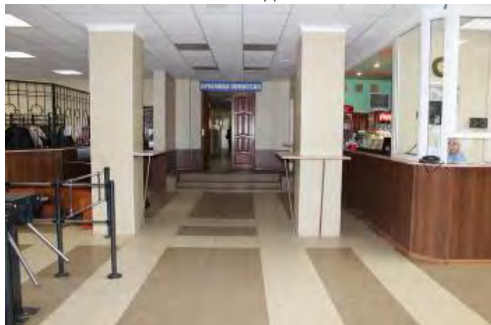
8. Холл 1 этажа