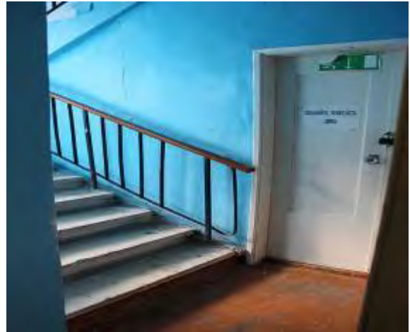
12. Эвакуационный выход