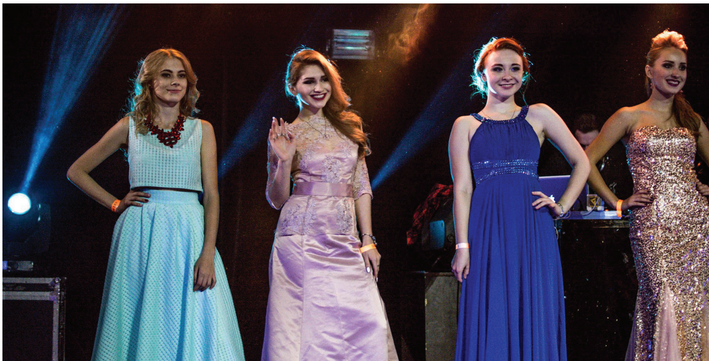
Участницы конкурса в ПРЕМИО