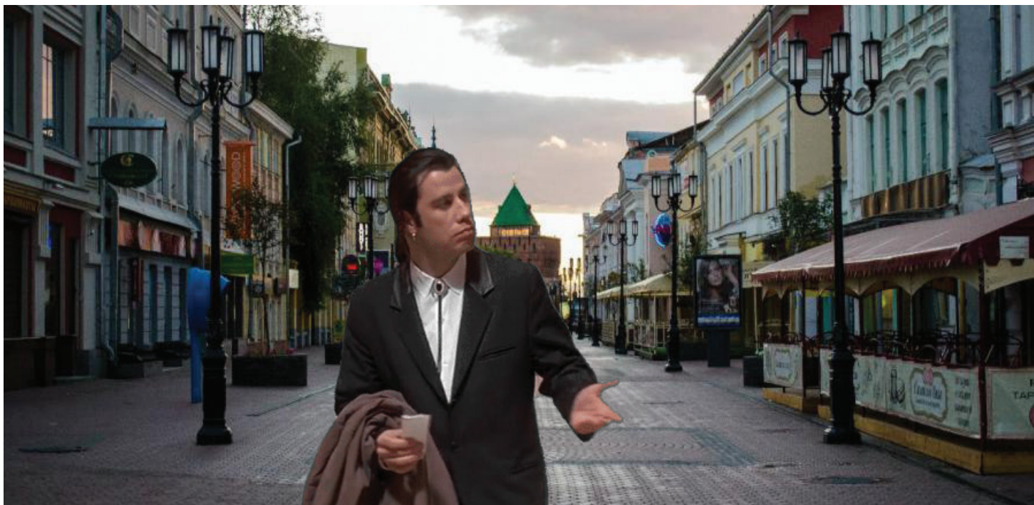
Винсент Вега из «Криминального чтива» потерялся на Покре, фотография из интернета