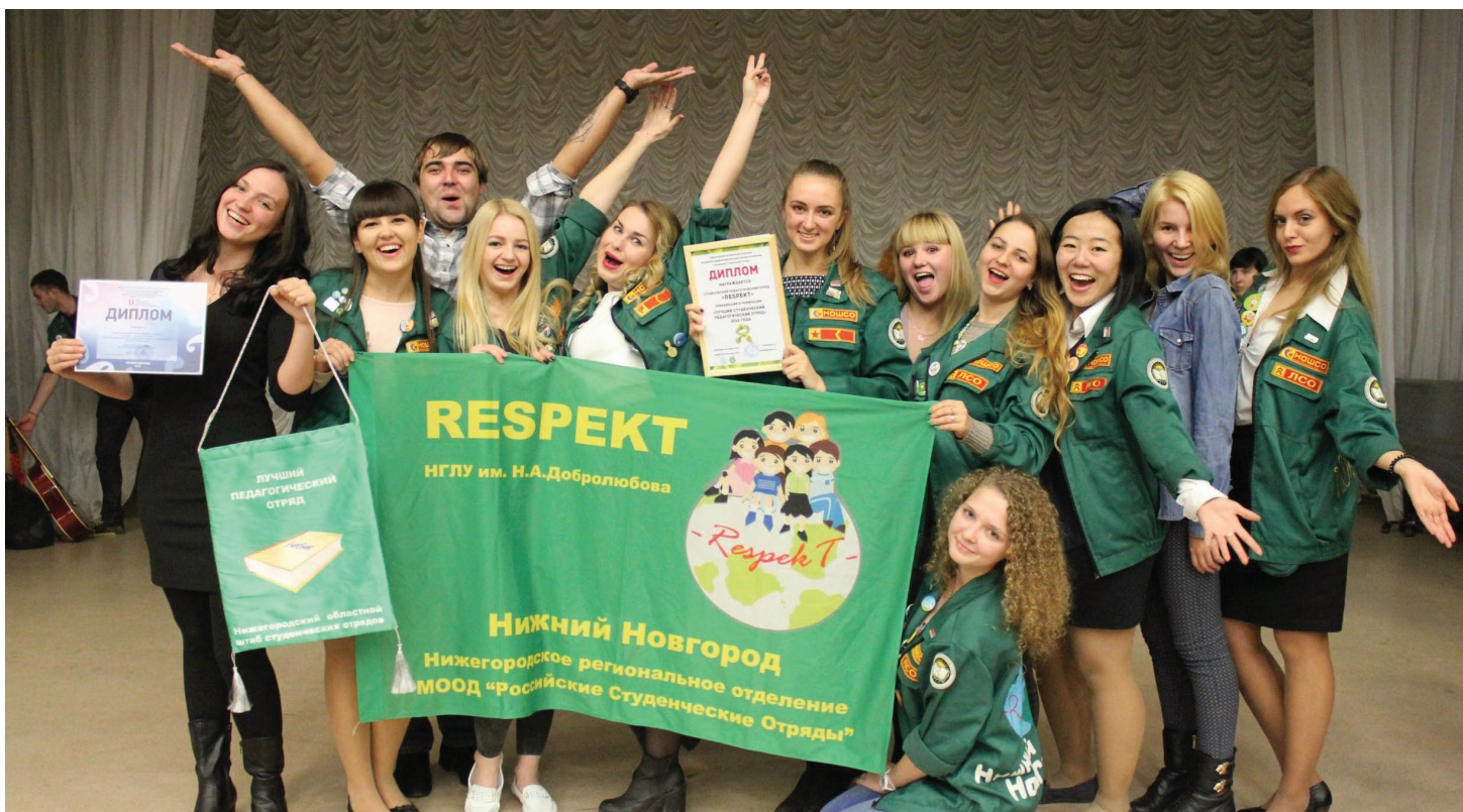
27 октября «Респект» получил звание «Лучшего студенческого педагогического отряда», фото «СОФ Нижний Новгород»