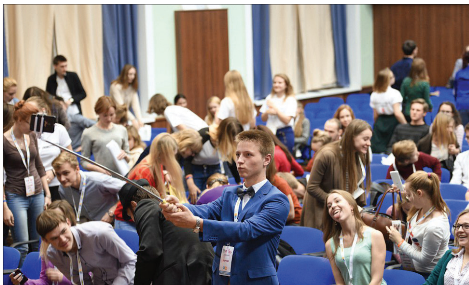
Мастер-классы проходили в большом актовом зале и в аудиториях, фото Павла Мезина

Пятый ежегодный форум молодых лидеров «YouLead» прошёл 28 октября в Нижнем Новгороде. Форум организован на базе НГЛУ им. Н. И. Добролюбова. Я отправилась узнать, чем он полезен для студентов, и кто же они — молодые лидеры?