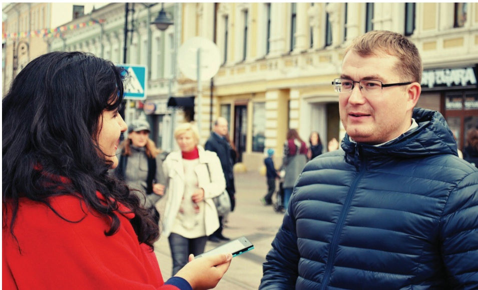
Интервью на «Дне улицы Рождественской»

Проработала в «Прогороде» я не больше полугода. Но я поняла: