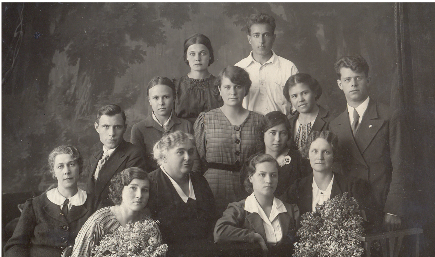
Студенты ГГПИИЯ в 1941 году.