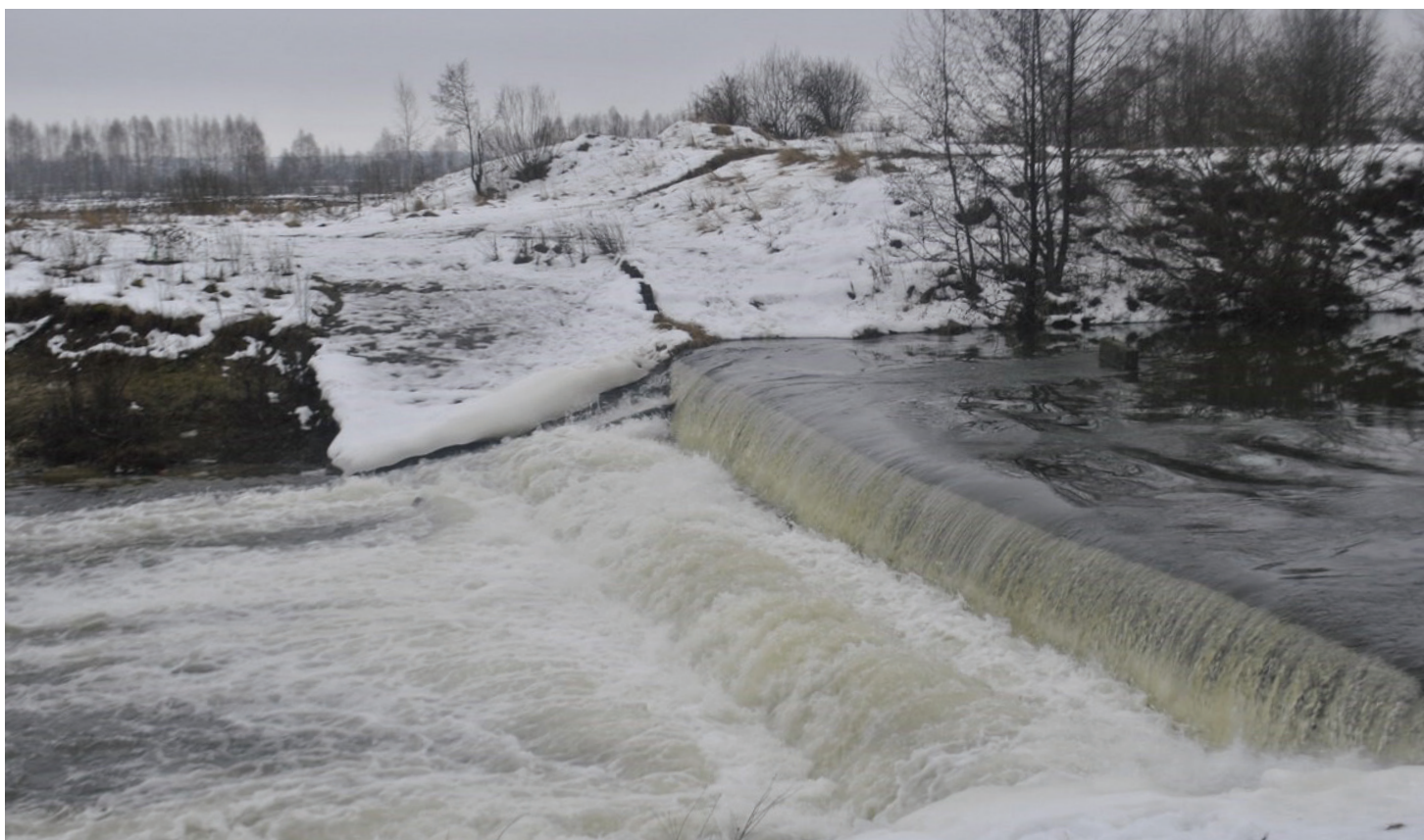
Искусственный водопад в глубине леса рядом с Зелёным Городом.