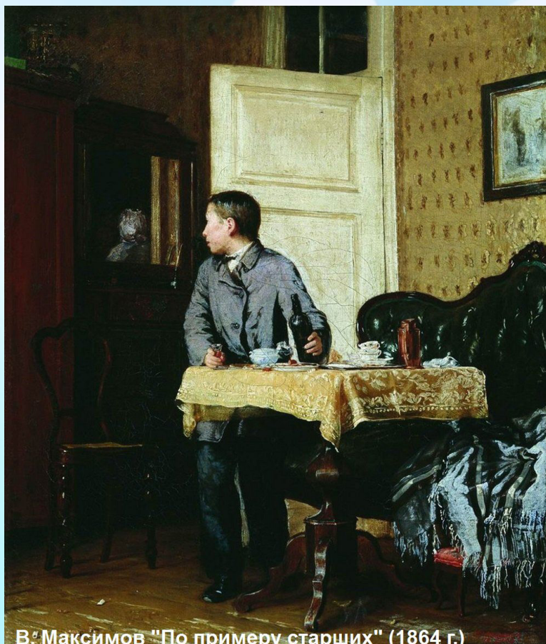
В. Максимов "По примеру старших" (1864 г.)

дойдет. Ориентиры — дело индивидуальное, тут в чужой «огород» влезть не так-то просто. Надо