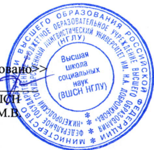
График ликвидации академических задолженностей по итогам ЗЭС 2023-2024 (прохождение второй повторной промежуточной аттестации) для студентов ВШСН 19.02.2024-24.02.2024