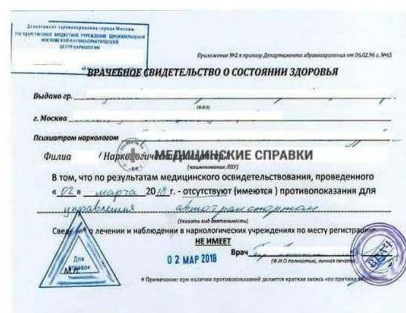
Сертификат на ВИЧ