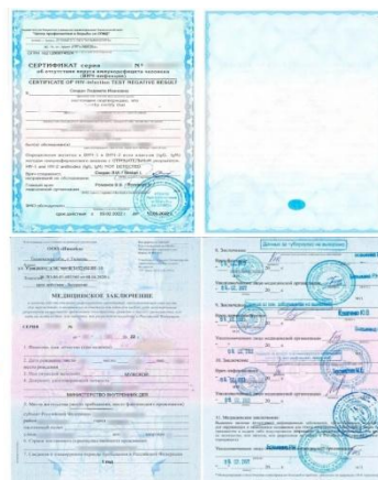
Медицинское заключение форма: 001-ИЗ

ALL OF THE RESULTS MUST BE HANDED OVER TO THE INTERNATIONAL DEPARTMENT AT LUNN (auditorium 3212) FOR COPYING