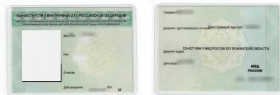
Документ о прохождении обязательной государственной дактилоскопии иностранных граждан в РФ

ВСЕ ПОЛУЧЕННЫЕ ДОКУМЕНТЫ НЕОБХОДИМО ПРЕДОСТАВИТЬ В МЕЖДУНАРОДНЫЙ ОТДЕЛ НГЛУ (аудитория 3114).